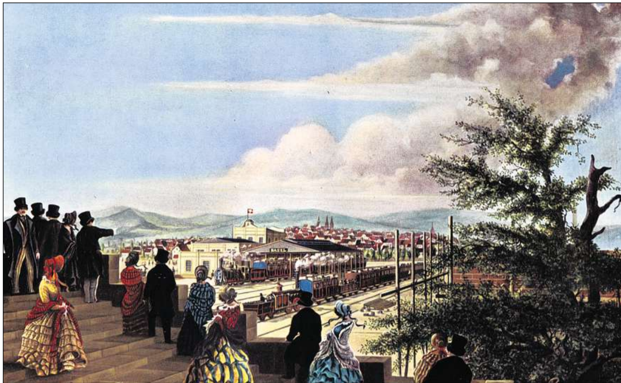
La burgaisia celebrescha il svilup industrial e tecnologic. (Maletg da 1847).

La viafier e cun ella il charvun han midà