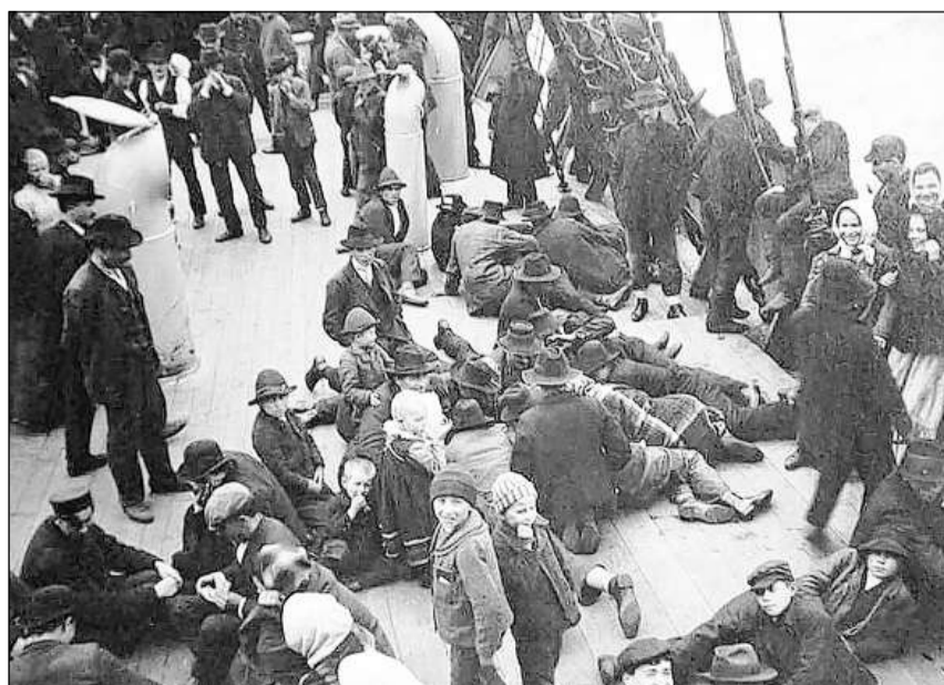
Emigrants da l'Europa en viadi sur l'Atlantic, ca. 1900.